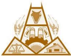
Cámara de Comercio, Industria, Productores y Propietarios de Puan