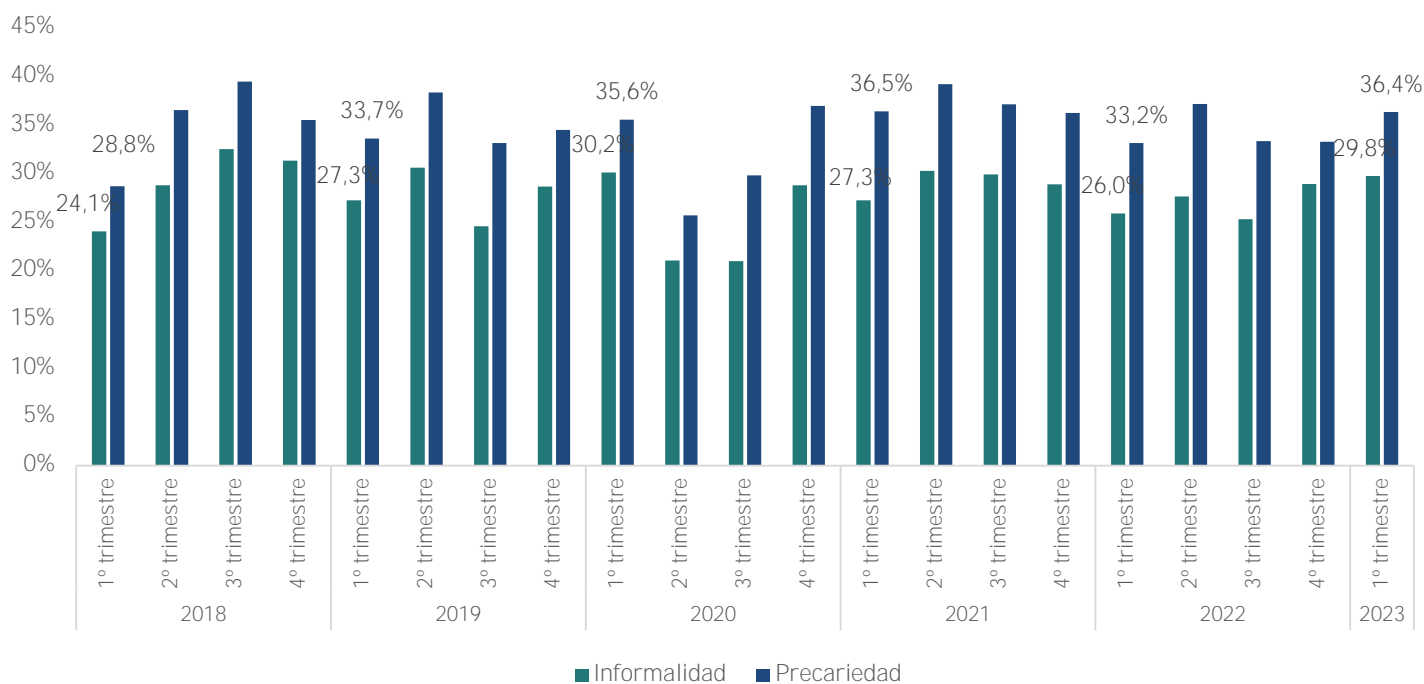
Gráfico 1: Evolución de las tasas del mercado laboral 1 er Trimestre de 2018 – 1 er trimestre de 2023- Bahía Blanca