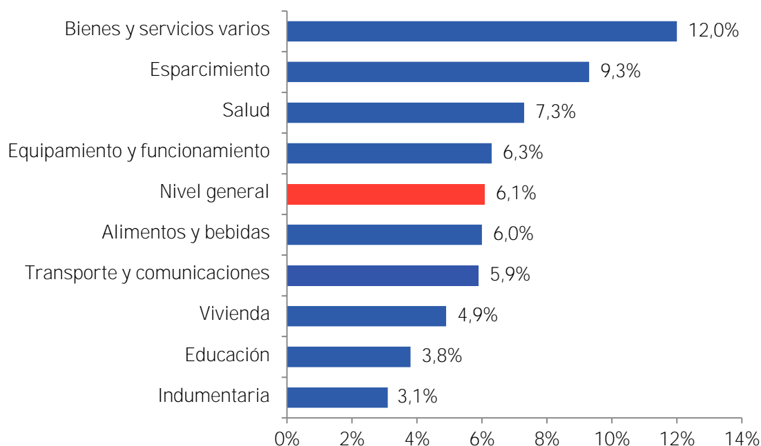
Gráfico 1: IPC CREEBBA por Capítulos Variación mensual – junio 2023 a julio 2023

Alimentos y bebidas , si bien se ubicó por debajo del nivel general, es el capítulo de mayor ponderación y registró una expansión del 6,0% durante julio como consecuencia de las siguientes variaciones: 63,7% en azúcar, 23,6% en empanadas y pizzas, 14,3% en yerba mate, 13,0% en postres lácteos, 12,0% en cacao y sus derivados, 11,7% en aceite mezcla y 11,3% en pastas frescas, entre otros.