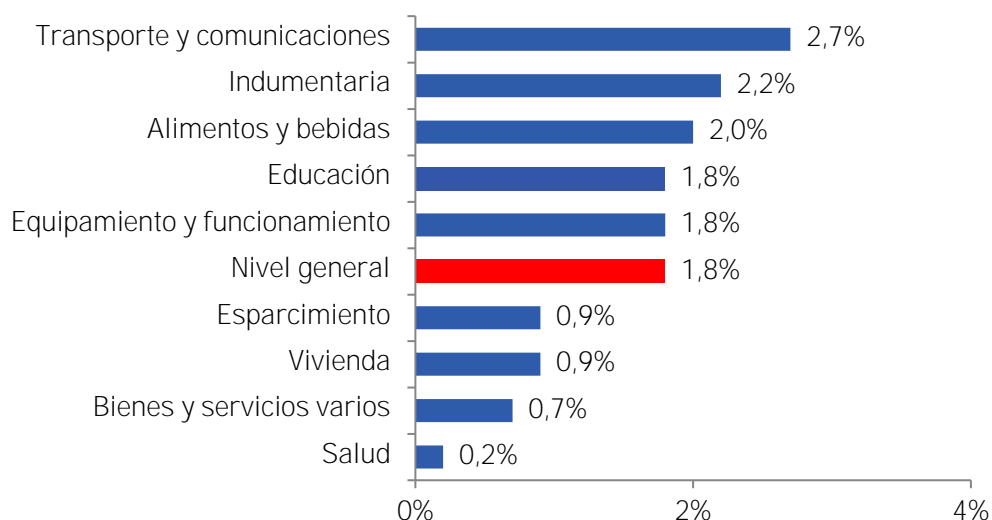
Gráfico 1: IPC CREEBBA por Capítulos Variación mensual – enero 2020 a febrero 2020

El resto de los capítulos se ubicaron por debajo de la inflación general del mes del 1,8%.