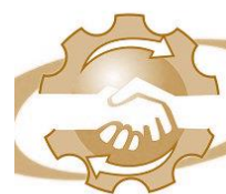
Cámara de Comercio e Industria y Anexos de Pigüé