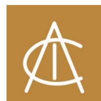
Asociación de Comercio e Industria de Cnel. Pringles