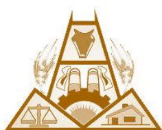
Cámara de Comercio, Industria, Productores y Propietarios de Puan