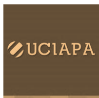
Unión del Comercio la Industria y el Agro de Punta Alta