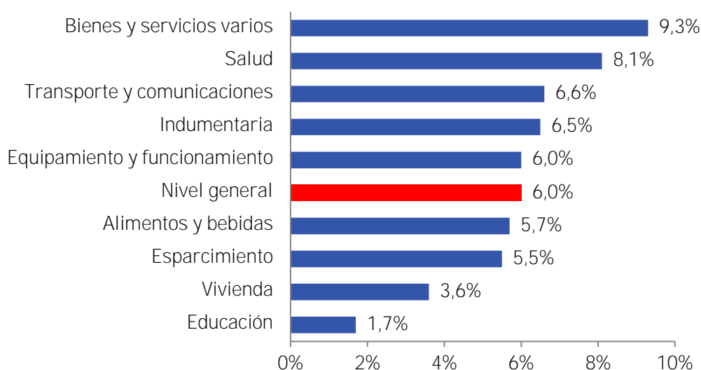
Gráfico 1: IPC CREEBBA por Capítulos Variación mensual – agosto 2019 a septiembre 2019

El resto de los capítulos también se ubicaron por debajo de la inflación general del mes del 6%.